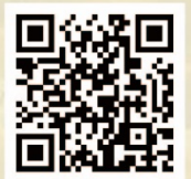
初賽報名及查詢 Enquiries and Enrollment

截止報名日期：2024年1月16日 總決賽日期：2024年2月23-25日 比賽地點：香港荃灣悅來酒店或各專業演出場地 *總決賽詳情以2023年12月香港區初賽公佈為準* Enrollment Deadline：16th January, 2024 International Final competition：23-25th February, 2024 Competition Venue：Hong Kong Panda Hotel, Tsuen Wan and professional performance venues *The details of the finals are subject to the announcement of the preliminary round in Hong Kong in December 2023.